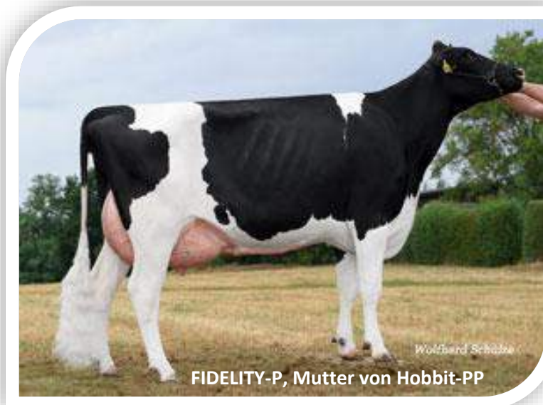
FIDELITY-P, Mutter von Hobbit-PP