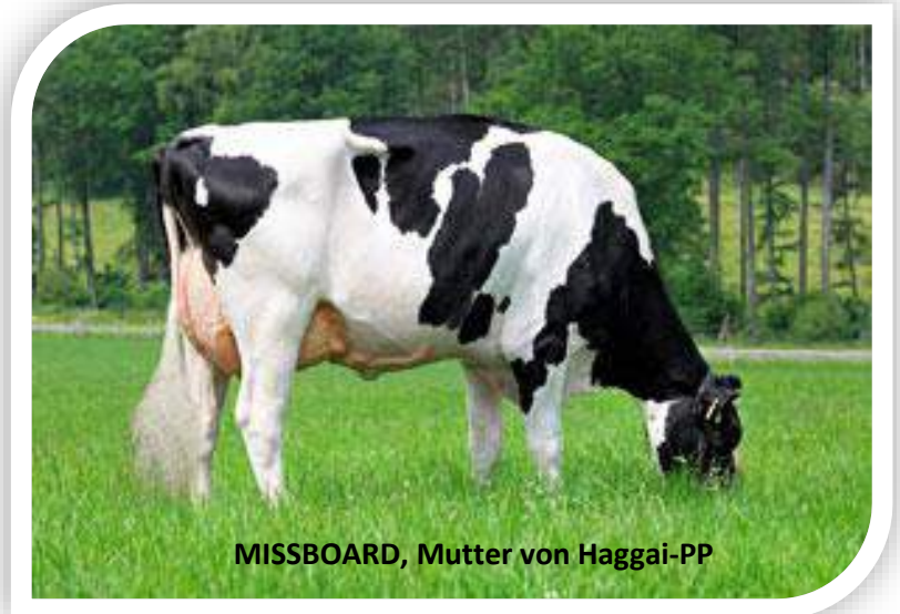
MISSBOARD, Mutter von Haggai-PP