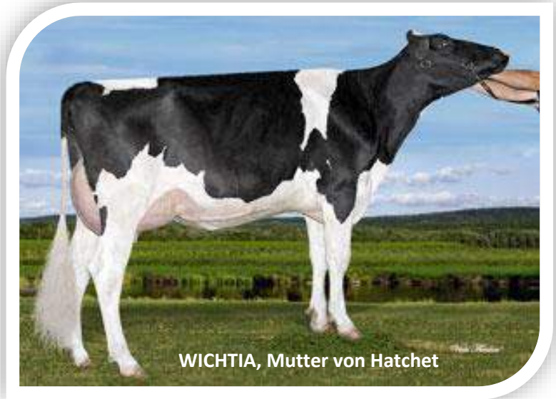
WICHTIA, Mutter von Hatchet