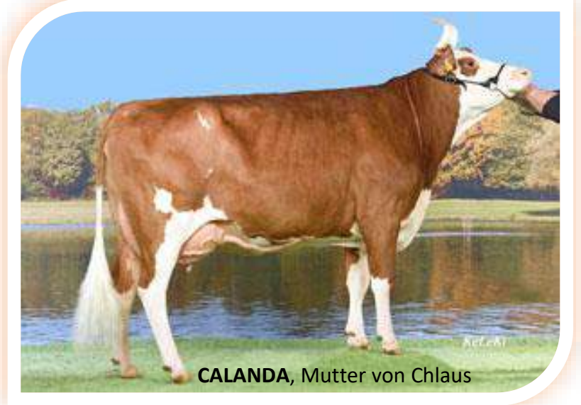
CALANDA, Mutter von Chlaus